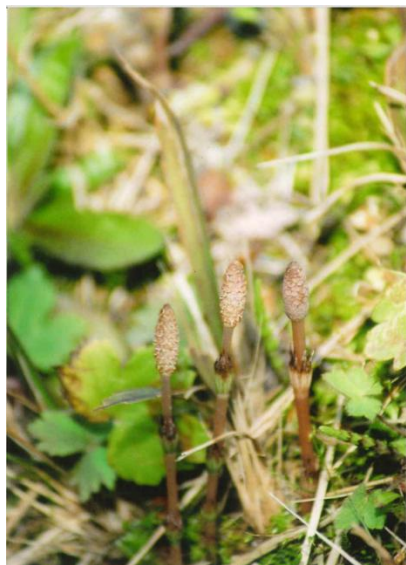
「つくしが出了」 松尾堤防にて