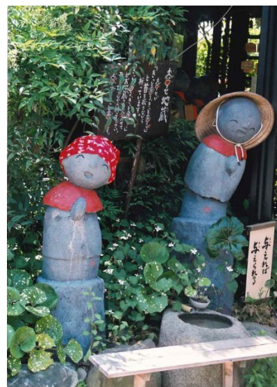
「地蔵夫婦でお出迎え」 愛宕道周辺にて