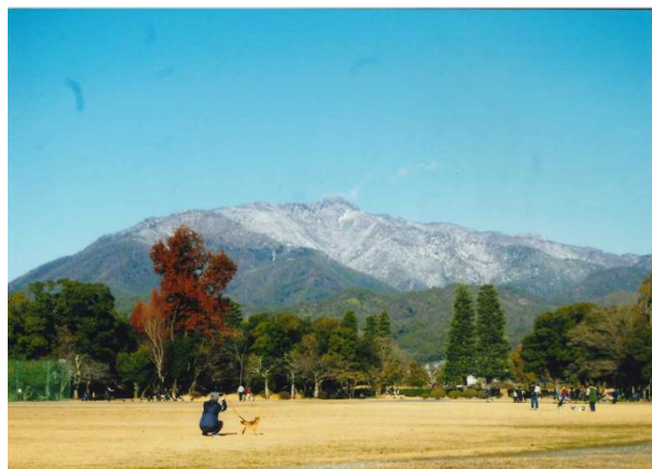
「愛宕山に冬が来た」 嵐山東公園にて